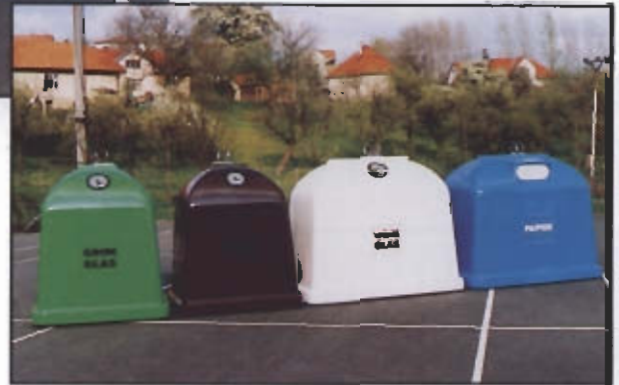
Q-3,2 M 3 UND Q-2,1 M 3 IN KOMBINATION