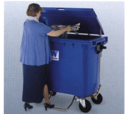
Deckelöffnung über Fußpedal