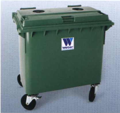
Glaseinwurf mit Gummirosette