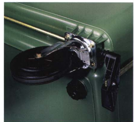
Fahrwerk mit Zentralbremse