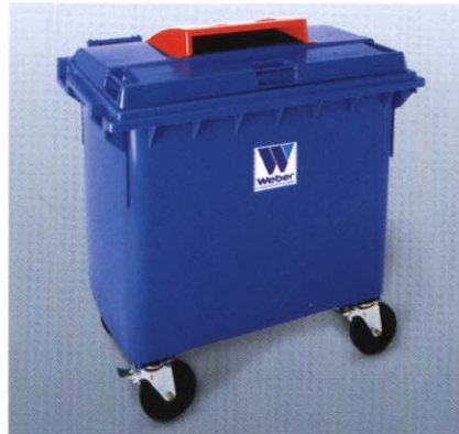
Papierbehälter mit Regenhaube