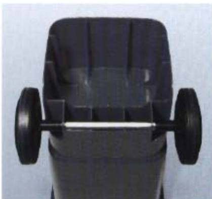
Bodengruppe MGB 80 l