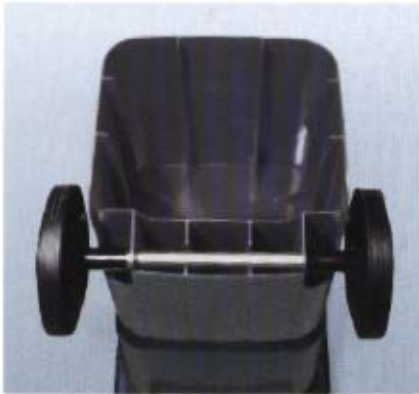
Bodengruppe MGB 60 l