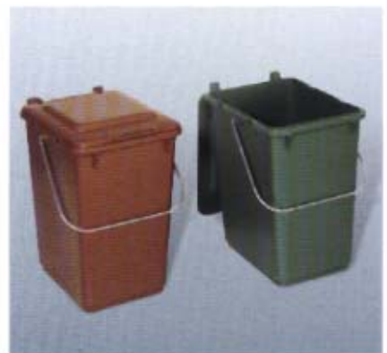
Vorsortiergeäß 10 l