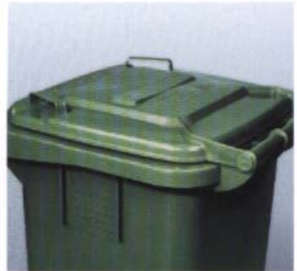
Belüftung für Biotonne