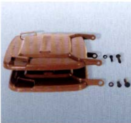
Deckel kompatibel zu diversen Modellen