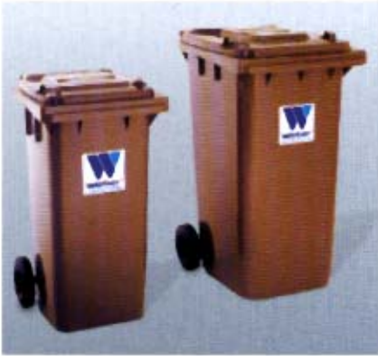
Für den Einsatz als Biotonne