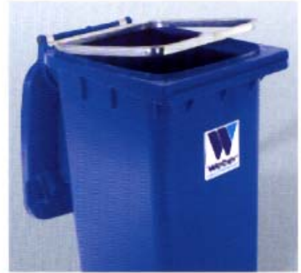
Ausstattung mit Müllsack-Klemmung